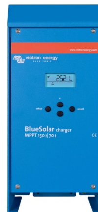
150/70 & 150/85 CAN-bus