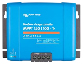
Contrôleur de charge solaire MPPT 150/100-Tr